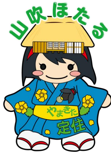
定住促進キャラクター