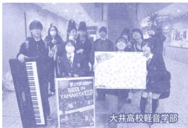
大井高校軽音楽部

第29回目となる「ライブ・イン・山北2025」が開催されました。南足柄市・足柄上地区にある高校の軽音楽部、15バンドが生演奏を披露しました。日々の練習の成果を発揮し、会場を盛り上げてくれました。お昼は山北高校のPTAの皆さんに、カレーライスを用意していただきました。出来立てのカレーライスはとても美味しく、みんなでいただきました。朝早くからありがとうございました。