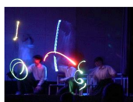
【保健体育科ダンス】