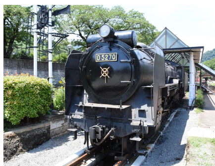
国内唯一の動態保存された D52型蒸気機関車