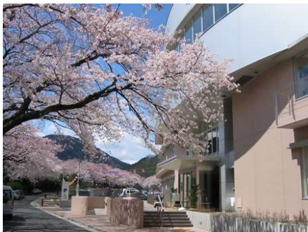
山北町健康福祉センター (2階 山北町子育て支援センター)