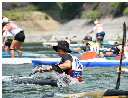
丹沢湖で毎年開催される カヌー・SUPマラソン