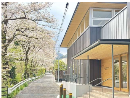
町産材を活用した 山北町立生涯スポーツセンター