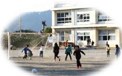
③ 体験活動・学習活動 ・自由遊び