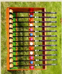
貸し出し用クラブ