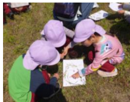
草花で顔をつくる園児たち