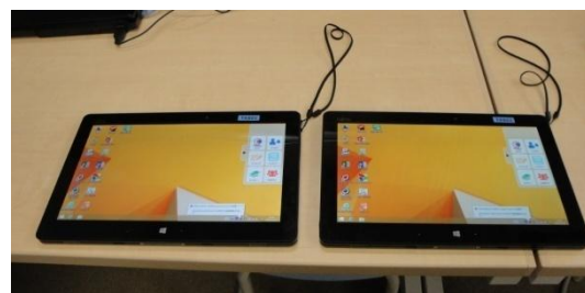
＜新たに導入したタブレットパソコン＞

タブレットパソコンは、新しい学習機材として注目されています。タブレットパソコンの画面を見ながらグループでの話し合い学習に活用するなどして、資料の活用能力や自分の考えを相手に伝える表現力を高めたりできます。また、電子黒板も学校の各階に置かれます。これから、子どもたちの学習の幅がますます広がります。