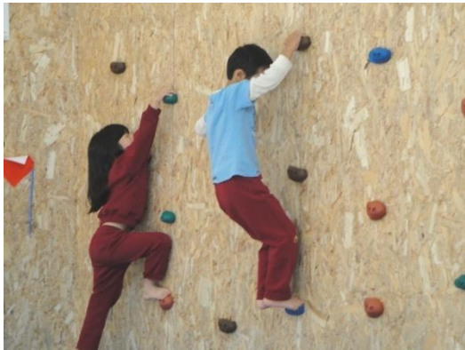
<岸幼稚園のボルダリング>

幼稚園では、東海大学体育学部 知念嘉史准教授を講師に「運動あそび」の研究をしています。今年度は保護者の方のご協力のもと、4・5歳児が一定期間 歩数計をつけたり、保護者アンケートをとったりして園児の生活の様子を調査しました。その結果、幼稚園ではたくさん遊ぶことで体を十分に動かしている反面、帰宅後は体をあまり動かしている様子が見られないことがわかりました。