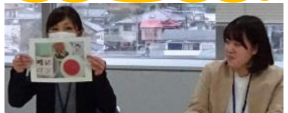
中学校からは「テスト応援献立」の実践が報告されました。