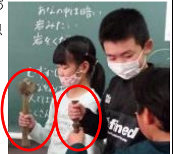
「のみ」や「げんのう」の重さに驚く子どもたち