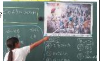
工事の想像図を見て気付いたことを、学級の仲間に伝える

川村小4年生が、社会科の授業でこの碑を手がかりに「昔から今へとつづくまちづくり」の学習をしました。子どもたちは、当時の様子を伝える読み物資料や工事の想像図、土木工事で使っていた道具の絵や実物、現在の「掘割」や「瀬戸せぎ」の写真と見学などとおして、動力のない時代にこれらの大工事が人々の手によって成し遂げられたことを具体的に学び、そのすごさに驚きました。そして、生活の向上や地域の発展を願って様々な苦心や努力を重ねてきた当時の人々の思いは、今を生きる自分たちの暮らしにつながっていることにも気付きました。地域学習が子どもたちの郷土愛を豊かに育む学びであることを、子どもたちの姿が語っています。