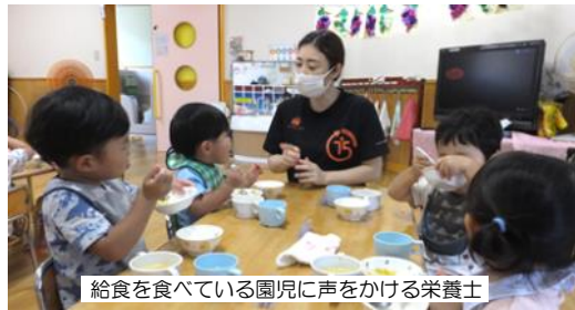
給食を食べている園児に声をかける栄養士

の基礎になるとも言われます。また、できるだけ給食時間に子どもたちの所に行って会話を交わすことで、食育につながるヒントを見つけることもあるということでした。友だちとテーブルを囲みながら「おいしいね!」と夢中になって食べる園児たちは笑顔いっぱいです。