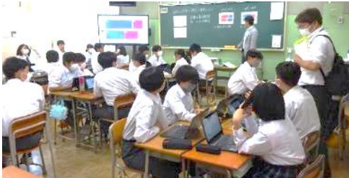
一人1台端末の導入から3年、多くの教科等で文房具のようにタブレットを使いながら自分やグループの考えを発信し、共有する授業スタイルがスタンダードになっています。

園・小・中の教職員で構成された授業後の部会別協議では、発達段階に応じた教育・保育活動への相互理解と学びの連続性についての意見交換等が行われ、教職員同士の顔の見える関係性もより深まった「学びの秋」となりました。