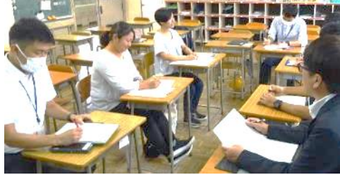
各クラスに分かれて行われた部会別協議では、授業の中で見取った子どもたちの姿を手がかりに、園・小・中それぞれの立場で山北の子どもたちに育む力を考えました。