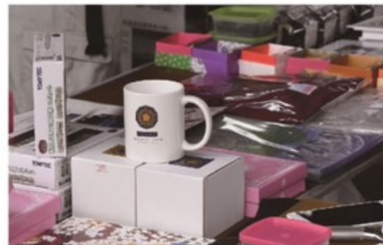
● D52 グッズ販売