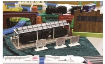
● できにワークショップ