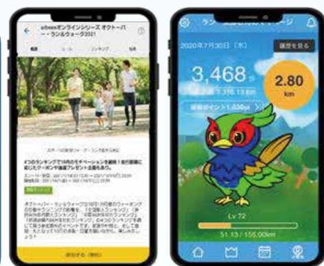
操作画面イメージ

記念品等 ・山北町内在住参加者各部門を通じ先着100名の方へ参加記念品をプレゼントします。 ・各部門山北町内ランキング1~3位の方へ入賞賞品を贈呈します。