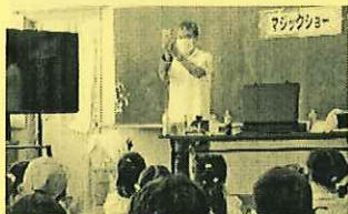
Mr. トミックのマジックショー