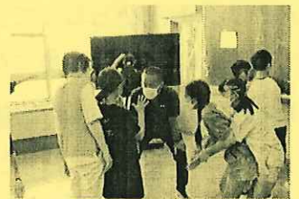
室内ゲーム、楽しいね

参加した子どもたちのスペシャルな3日間を支えてくださったのは、放課後子ども教室安全管理員やボランティア・ゲストティーチャーの皆さん併せて延べ約80人の方々です。本当に多くの方々にご協力いただき、子どもたちが楽しく安全にプログラムを行うことができました。ありがとうございました。