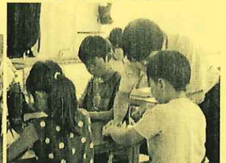
折り紙で「恐竜」を作る