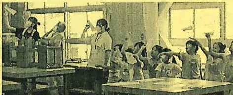
紙飛行機を作って飛ばそう