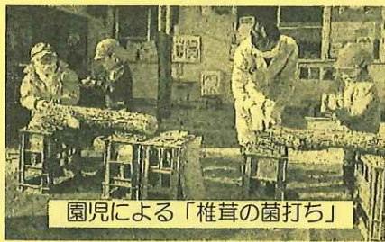
園児による「椎茸の菌打ち」

豊かな自然に恵まれた山北町の環境を生かし、山北の子どもたちがそれぞれの段階に合わせてその恵みを受け取る「学び」への取り組みを始めています。3園では、地域の方々の協力を得ながら町内の伐採木を使って椎茸の菌打ち体験をし、今後各園で栽培していきます。小学2年生は、生活科「あきをさがそう」をテーマにどんぐりなどの木の実や落ち葉などの秋探しを共和地区で行いました。小学5年生は、社会科「国土の自然とともに生きる」をテーマに、ゲストティーチャーによる森林に関する授業や林業体験を行いました。子どもたちは、教室でのお話と間伐体験・森林散策体験をとおり、「山を守り、山を育てる森のレスキュー隊になって、少しでも山を豊かにしてほしい」と語る地域の皆さんの熱意をしっかりと感じ取っていました。