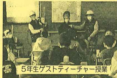
5年生ゲストティーチャー授業