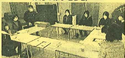
保育参観後の情報交換・協議

各園長も、保護者・地域の方々と双方向で情報交換・協議できる3園運営協議会の設置により「園の取り組みなど委員の皆さんと気軽に相談できるようになりとても心強い」「いただいたアイデアやご意見を園の活動に取り入れたり、すぐに実行したりできるよさが生まれた」「園だけの視点だけでなく、地域からの視点を聞けることに感謝している。もっと地域を知らねばという思いが強くなった」ことを実感しています。