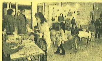
生涯学習センターフェスティバルの様子