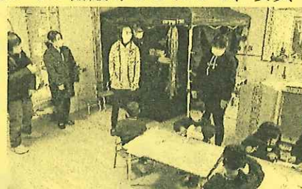
保育の様子を参観