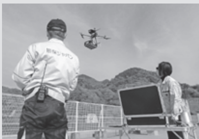
目的地へ向け飛び立ちます