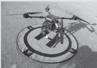
今回の訓練で使用したドローン