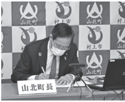
協定書に署名する湯川町長