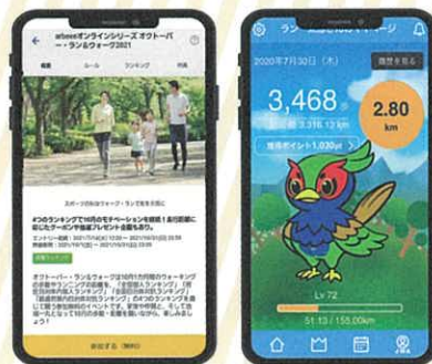
操作画面イメージ

記念品等 ・山北町内在住参加者各部門を通じ先着100名の方へ参加記念品をプレゼントします。 ・各部門山北町内ランキング1~3位の方へ入賞賞品を贈呈します。