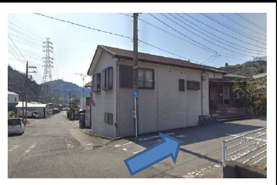
写真④ まつざわ商店前