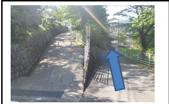
写真③ 山北中学校前