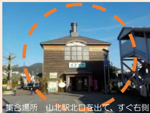
集合場所 山北駅北口を出て、すぐ右側