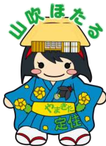
定住促進マスコットキャラクター