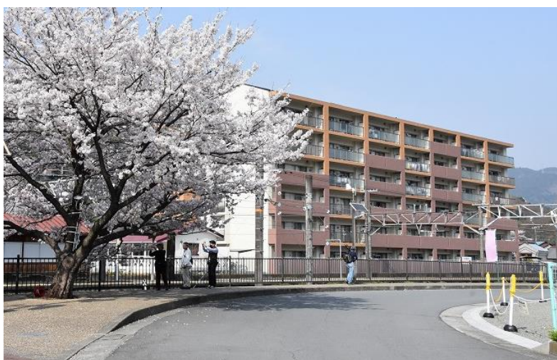
サンライズやまきた