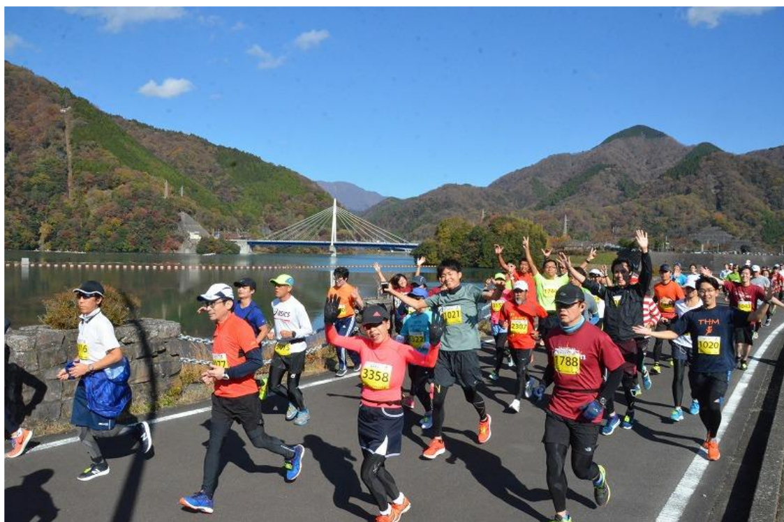
丹沢湖ハーフマラソン