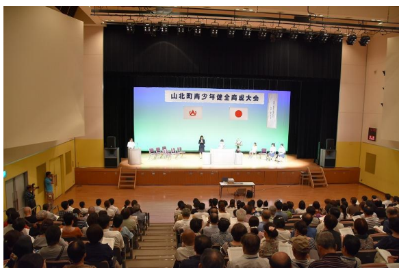
青少年健全育成大会