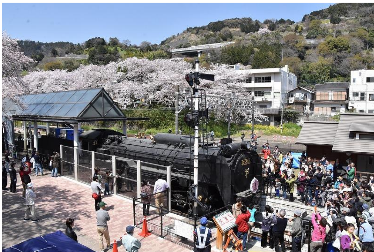
山北鉄道公園蒸気機関車 D5270号機