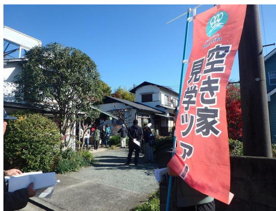
空き家見学ツアー