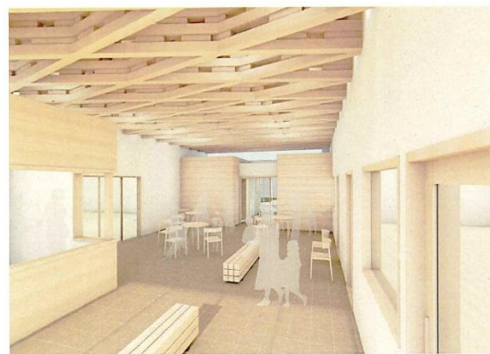
□ ホールイメージ図