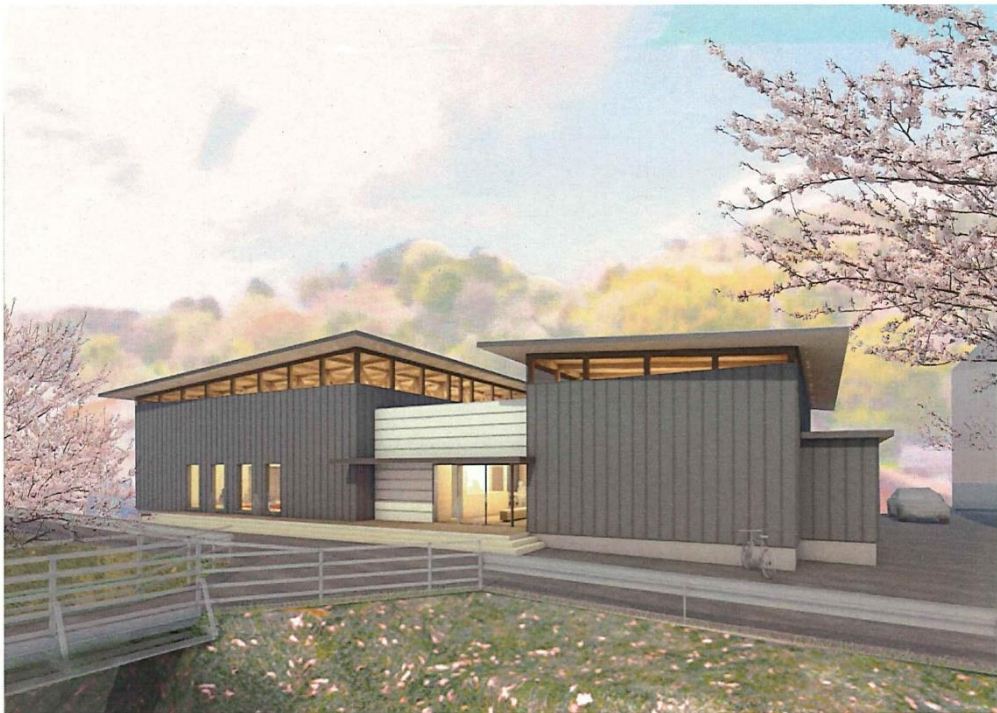
旧山北体育館代替体育施設完成イメージ