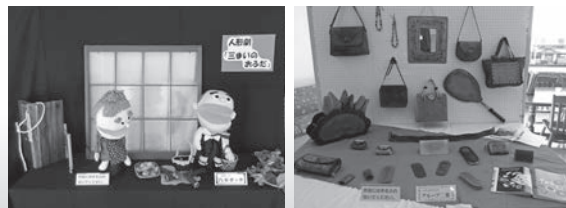
★写真は昨年の作品展示発表より

日時：2月4日(木)～7日(日) 9:00～17:00 (ただし4日は13:00から) 場所：1階ロビー・ホワイエ、2階ギャラリー・展示ホール ○生涯学習センターで開催した教室や生涯学習センター登録サークルの作品や写真パネルを展示します。