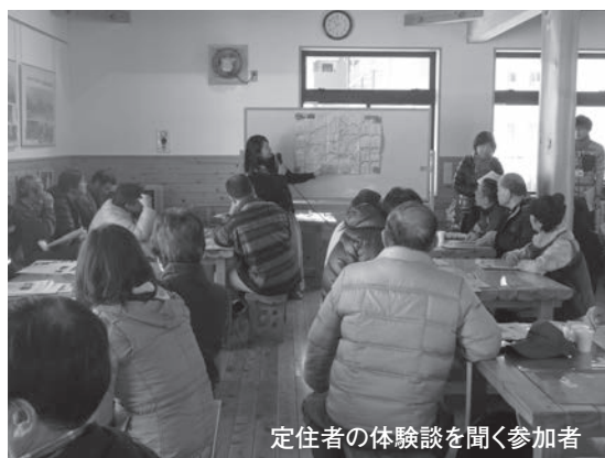
定住者の体験談を聞く参加者

今後もやまきた定住協力隊を中心に空き家見学ツアーの内容を充実させ、山北町への定住促進を図ります。