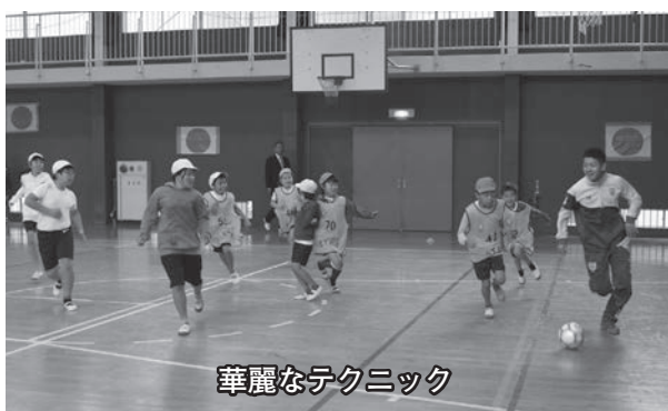
華麗なテクニック

11月16日、三保幼稚園の園児、三保小学校の児童が湘南ベルマーレフットサルクラブの選手と交流を行いました。