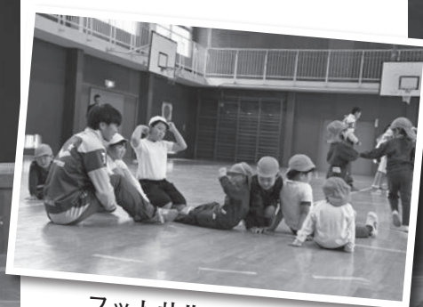
フットサルって楽しいよ