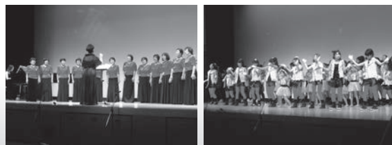
★写真は昨年の芸能発表会より

日時：2月7日(日) 13:00開演(12:30開場) 場所：多目的ホール(入場自由・無料) 演目：大型紙芝居・コーラス・各種体操ほか ○生涯学習センター登録サークルが1年間活動した成果を発表します。