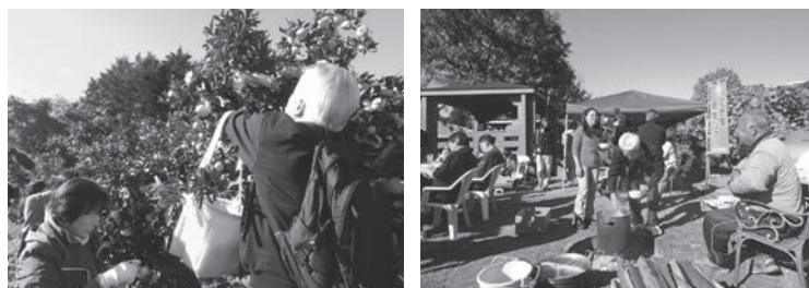
地域体験イベント「みかん狩り」「しし鍋」