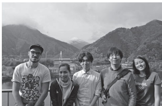
今回参加した外国人の皆さん

新たな観光資源発掘のため、外国人を対象とした「やまきた町歩き」が11月23日、24日の二日間にわたり初めて実施され、日本に滞在する韓国・中国・ブラジル・フィリピン・オーストリア出身の20代の若者5人が参加しました。参加者は大野山や ほうきすぎ 箒杉などの観光名所を訪れ、西丹沢自然教室周辺での森林セラピー、丹沢湖でのサイクリング、パークゴルフなどを体験、中川温泉に宿泊し、地元住民との意見交換も行われました。