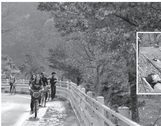
紅葉の中をサイクリング