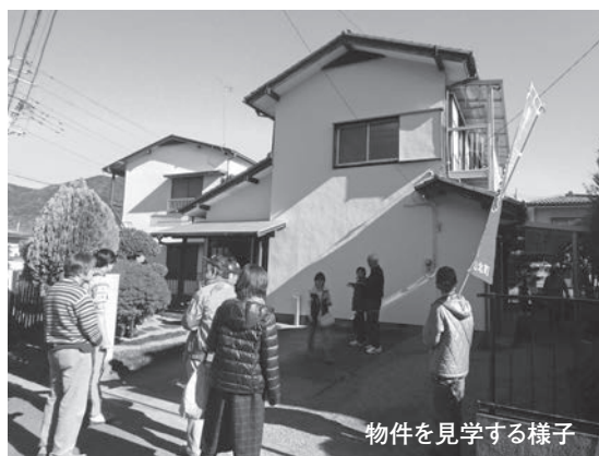
物件を見学する様子

山北町へ定住を希望されている方に、やまきた定住協力隊が物件の紹介と地域性の説明をしながら町内を回り、町の雰囲気と魅力を知っていただくことで定住促進に繋がるように、毎年空き家見学ツアーを開催しています。