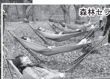
森林セラピーを体験