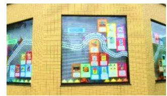
休館中でも、大きな窓を利用して「お勧めの本」を情報発信しました