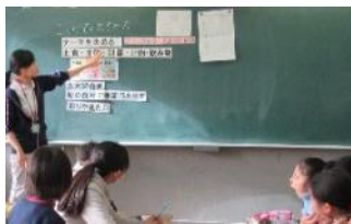
【栄養教諭による献立作りの授業】

各校「お弁当の日」に向けて、児童会・生徒会活動とタイアップした事前指導の実施やお弁当設計図を描いたり記録を残したりするためのワークシートの活用等、創意工夫した取組を行っています。特に大事にしているのが、実施後の振り返りです。毎回次回への期待感や改善策が記載されたものが多く、これも継続した取組の成果の一つです。