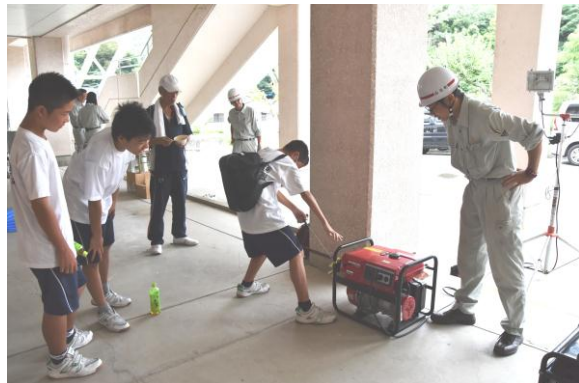
（発電機による照明確保訓練）

中学生は、それぞれの自治会が実施する防災訓練に参加し、地域の方々のアドバイスを受けながら、地域の一員として有事の際に行動ができるよう、真剣に取り組んでいました。