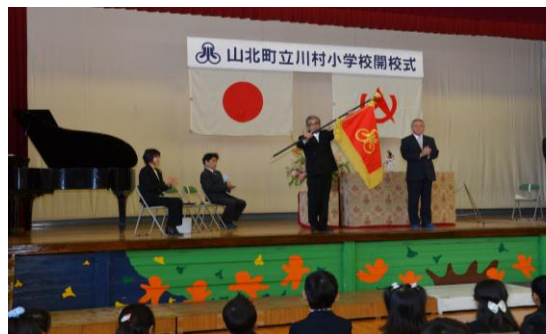
【川村小学校の開校式・入学式】

「両校のよさを受け継ぎ、児童がともに楽しい生活が送れるように全力で取り組みます。」という校長先生のあいさつをしっかりと聞く全校児童の姿が見られました。児童のこれからの成長・活躍が楽しみです。