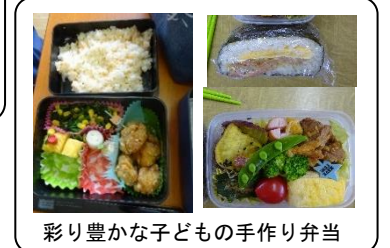
彩り豊かな子ども手作り弁当