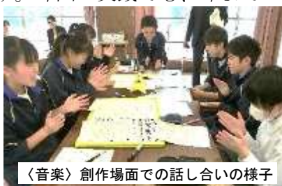
〈音楽〉創作場面での話し合いの様子

教科担任制の中学校では、他教科の専門的な内容について協議するのは難しいと受け止められがちですが、「授業の核は全教科同じである」という考えを学校全体で共有し、研究協議を重ねてきています。その共通基盤としてどの教科でも取り組まれているのが、グループでの話し合いです。今回の実践でも、今までの成果の上に新しい形での話し合いが活発に行われていました。