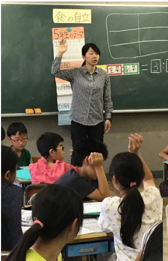
栄養士による事前指導