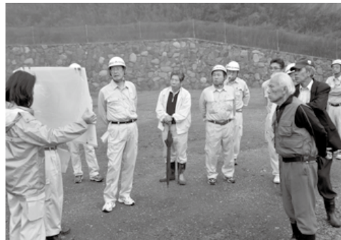
(仮称) 山北つぶらの公園整備 (共和地区)

は早急に対応しています。また、県や国の所管事項についても、関係機関に要望を重めています。