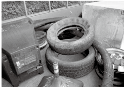
タイヤやテレビ、冷蔵庫などの投棄も後を絶ちません

者が各地域の道路や河川、用水路などの美化活動を行いました。また、19日の重点日には、朝から多くの方が参加し、日中の降雨にもかかわらず、アイヤテレビなど多くのごみが回収されました。