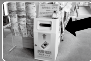
役場庁舎2階の環境農林課前に「専用回収ボックス」を設置しています