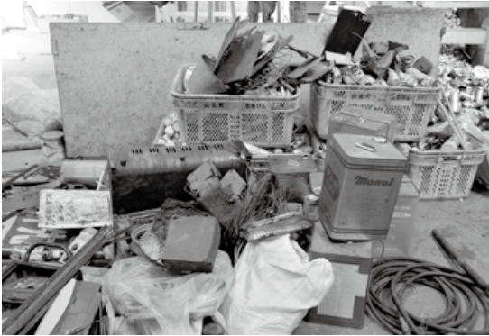
空き缶や空きビンをはじめ多くの金属類が投棄されていました