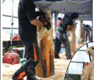
▲頭で描くイメージ通りに削っていきます

11月1日、大野山で第4回神奈川チェンソーアート競技大会が開催され、11名の競技参加者(チェンソーカーバー)たちが、1本の丸太を大胆かつ繊細に削り、素晴らしい作品を作り上げました。