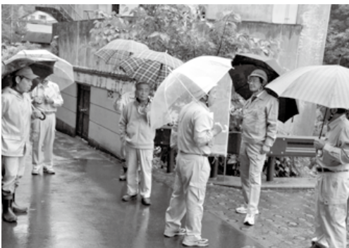
町道拡幅 (三保地区)