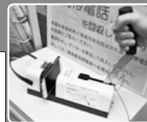
携帯電話の電池を外し、回収ボックス上部にある工具で携帯電話を破壊してから、ボックスに投入してください

これからも散乱ごみや不法投棄のない、美しい町やまきたを目指して、みなさんの手で町の環境保全に努めていきましょう