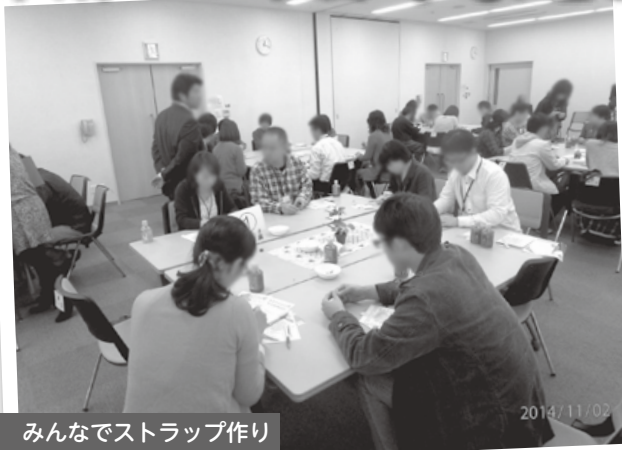
みんなでストラップ作り

山北町では、若者の町への定住促進の取り組みとして“山北町で出会い、将来は山北町に住んでほしい”との思いから平成24年度より婚活イベント「やまきたLove婚」を開催しています。