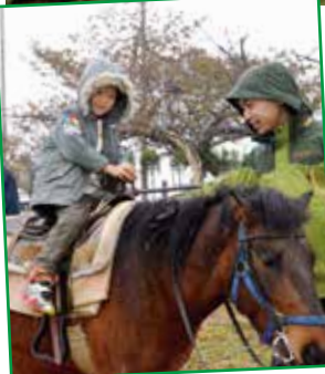
馬の背中はどうな感じだったかな?