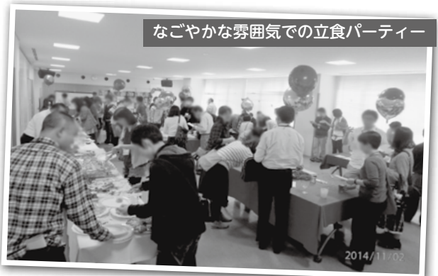
なごやかな雰囲気での立食パーティー