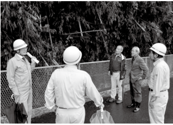
町道安全対策 (岸地区)

は早急に対応しています。また、県や国の所管事項についても、関係機関に要望を重めています。