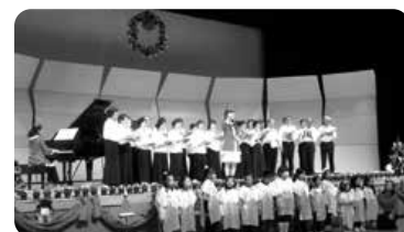
★写真は去年のコンサートより

※出演者募集中です!申込み・練習などの問合せは 生涯学習センター事務局Tel(75)3131までご連絡ください。