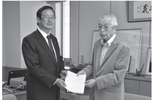
町長に答申書を提出する大胡田会長

この答申を受け、町では引き続き、施設の維持補修や定期的な水質検査等を行い、安全でおいしい水を供給していきます。