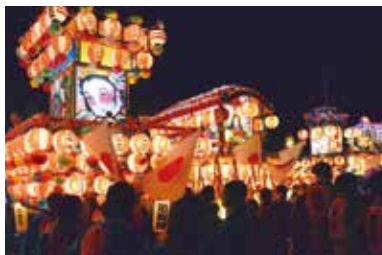
夕暮れには、また違った雰囲気包まれる

昔ながらの形態を存続している貴重な祭りに、多くの見物客が訪れて、祭りの様子をカメラに収めていました。