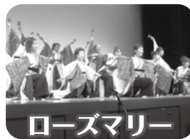
ローズマリー (大人のジャズ体操)

日時：2月3日(日)13:00開演(12:30開場) 場所：1階 多目的ホール(入場自由・無料) 演目：大型紙芝居・コーラス・各種体操ほか