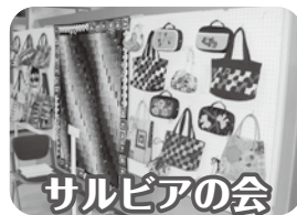
サルビアの会 (パッチワーク)