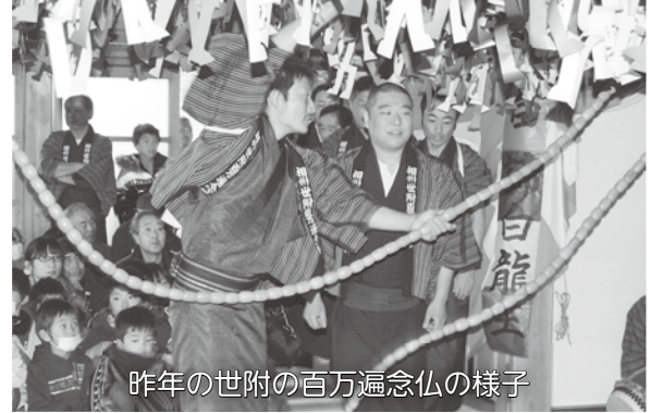
昨年(2013年)の世附の百万遍念仏の様子