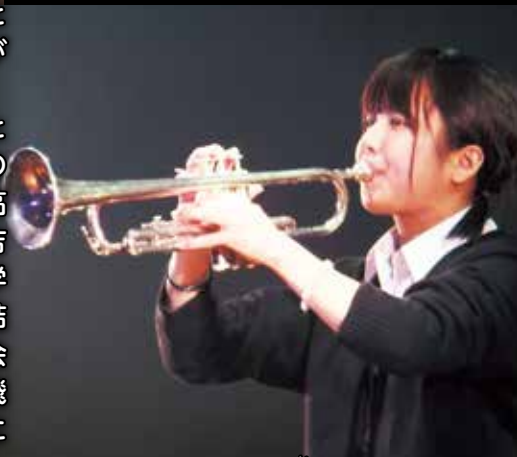
特技を活かしたパフォーマンス