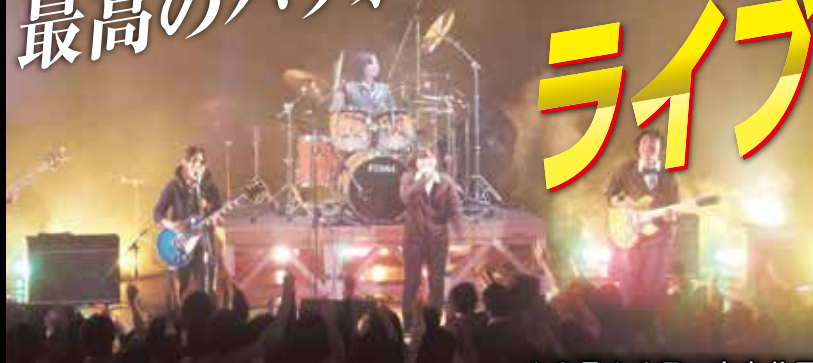
会場が一体となって盛り上がりました