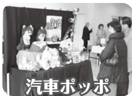
自動車ポッポ (人形劇)

日時：2月2日(土)～11日(月)9:00～17:00 (ただし2日は13:00から、11日は16:00まで) 場所：2階ギャラリー・展示ホール・1階ロビー