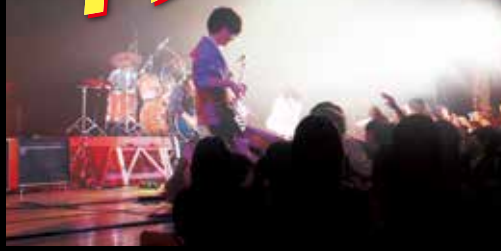
熱い演奏に観客は大興奮

12月16日、中央公民館において、第16回目となるライブ・イン・山北が開催されました。