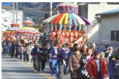
たくさんの人の手によって町内を巡行