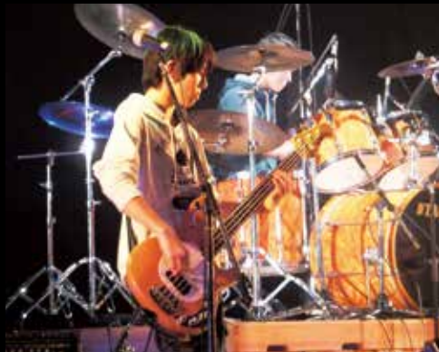
素晴らしい演奏を披露

今回も素晴らしい演奏と歌声を披露してくれたのは、山北高等学校、足柄高等学校、大井高等学校、吉田島総合高等学校、立花学園高等学校の生徒の方で結成された全14バンド。会場内は、冬の寒さも吹き飛ばすほど、若さ溢れる熱気に包まれました。