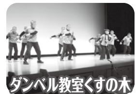
ダンベル教室くすの木 (男性ダンベル体操)