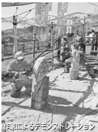
作家によるデモンストレーション