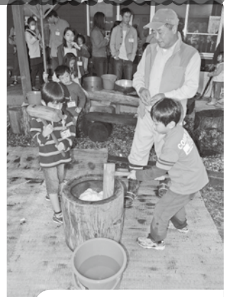
おいしいお餅にな〜れ