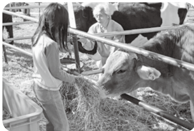
子牛もこんなに食べるんだよ