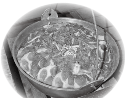
地元産野菜をたくさん使ったしし鍋