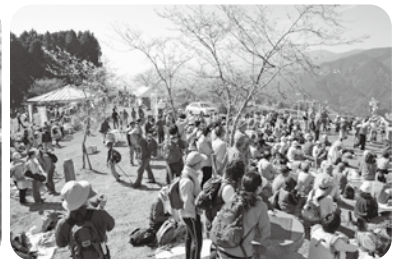
多くのハイカーたちで賑わう山頂