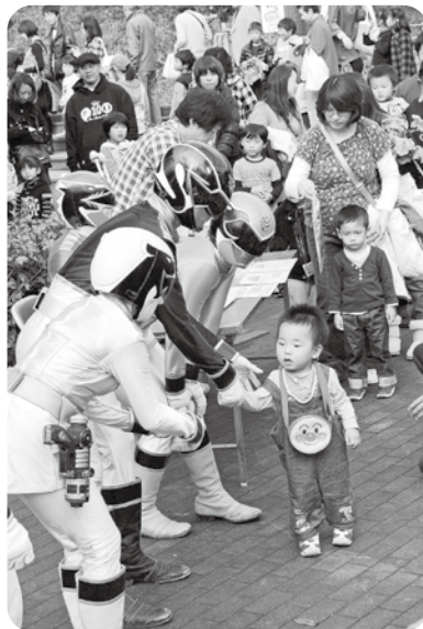
子どもたちに大人気! キャラクターショー