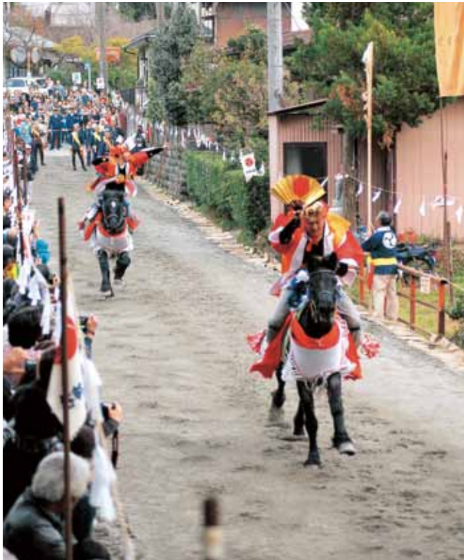
大観衆が見守る中で射る