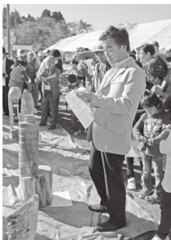
松沢前知事も訪れ作品に投票