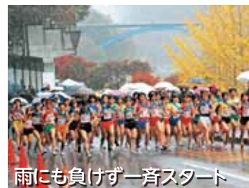
雨にも負けず一斉スタート

男子は7区間 42.195 km、女子は5区間 21.075 kmを各選手が懸命に みぞ 襻をつないでいく姿に、チームワークの大切さを強く感じました。