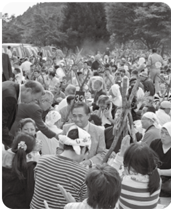
黒岩知事も 楽しいひとときを過ごされました