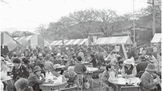
農林業・商工業いろいろなお店が出ています