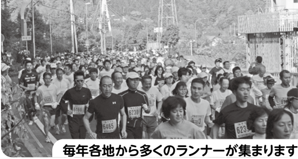
毎年各地から多くのランナーが集まります