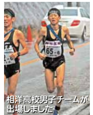
相洋高校男子チームが出場しました