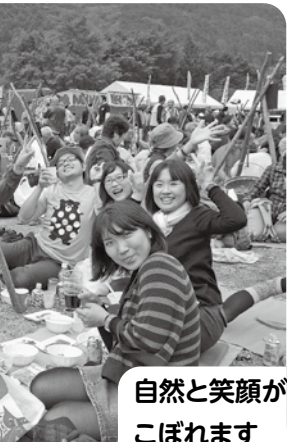
自然と笑顔が こぼれます