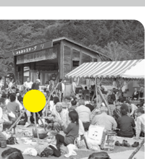
1000人を超す参加者 で賑わう会場