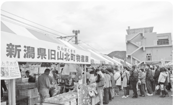
お目当ては新潟県村上市の海産物