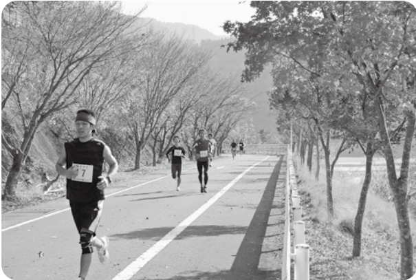
紅葉の中で気分も爽快