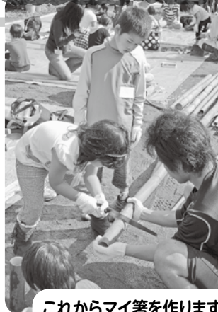
これからマイ箸を作ります