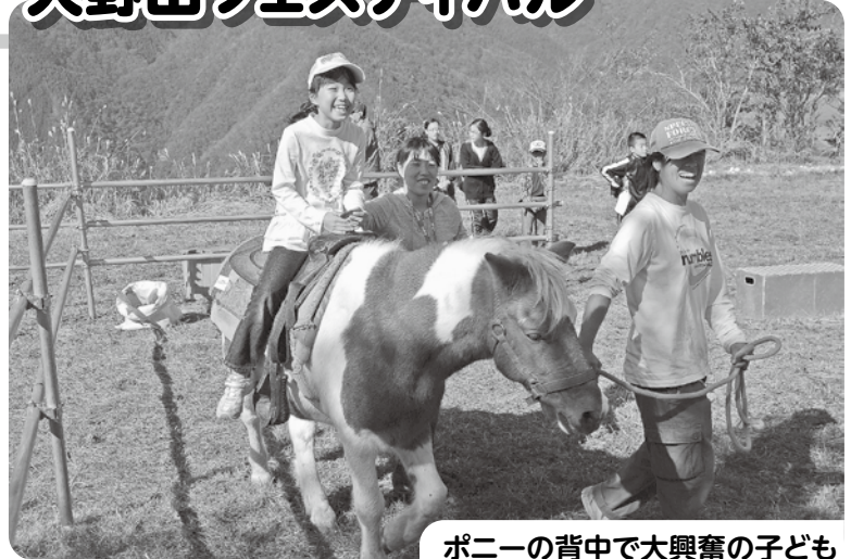
ポニーの背中で大興奮の子ども