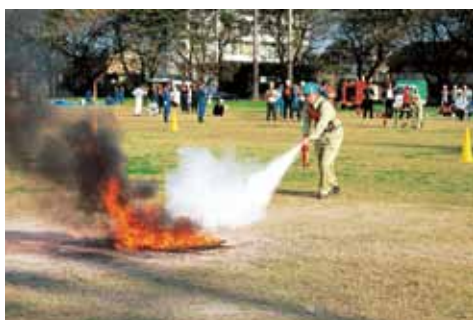
初期消火で延焼防止