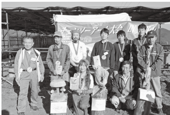
参加した選手たちと入賞作品