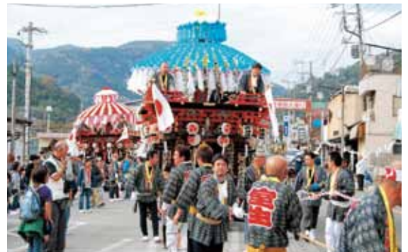
雅やかな花車の巡行