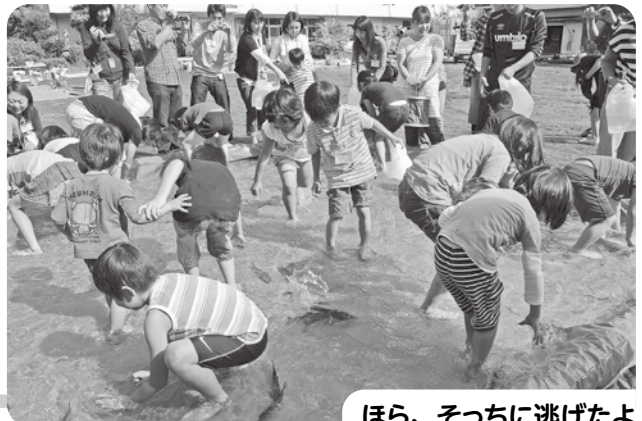
ほら、そっちに逃げたよ