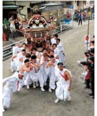
勇ましい神輿の宮入り

また、多くの観客が集まるなか、流鏝馬神事が行われました。馬場を駆け抜け矢を射る姿に、観客からは大きな拍手が送られました。