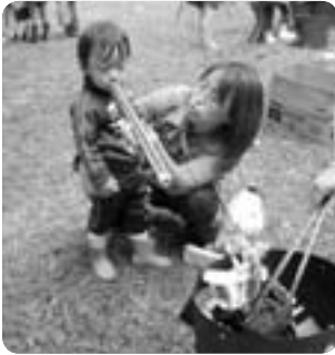
思いっきりフウ～って吹くんだよ