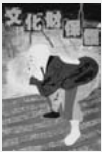
「世附の百万遍念仏」の二上がりの舞