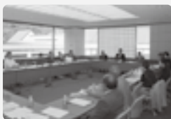
第6回山北町 総合計画審議会の様子