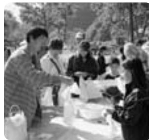
足柄茶染め体験 どんな模様になるのかな？