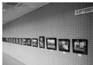
広美会 ちぎり絵展【6月20日～7月4日】