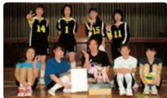
バレーボール 優勝 向原ブロック

なお、ソフトボールについては7チームが参加し、晴天の下、白熱した試合を制した向原ブロックが優勝しました。